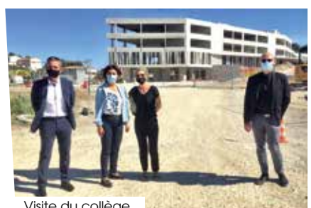
Visite du collège

Le 27 mai dernier, la Présidente du CD13 Martine Vassal s'est rendue dans notre commune afin de visualiser l'état d'avancement des travaux du collège.