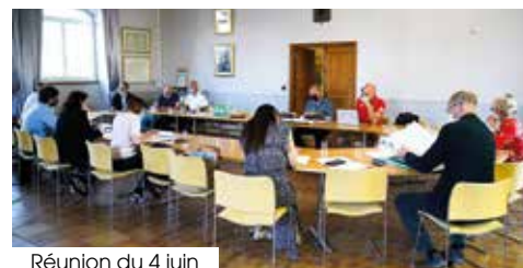
Réunion du 4 juin

A cette fin, une réunion avec les différents partenaires s'est tenue le 4 juin en salle d'honneur.