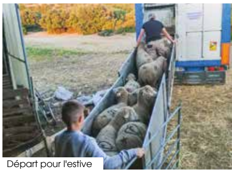
Départ pour l'estive