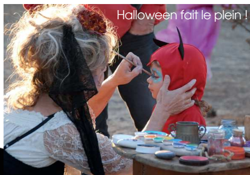
Halloween fait le plein !

La file d'attente s'étirait pour profiter du stand gratuit de maquillage : des visages « effrayants » dessinés avec art par des bénévoles. 250 cadeaux ont été distribués aux enfants. Côté animations, la Compagnie Estock Fish présentait ses échassiers et ses cracheurs de feu ; l'Arche de Luna a théâtralisé la scène durant toute la manifestation. Une grande distribution gratuite a régalé les participants : vin chaud et chocolat chaud, plus de 100kg de bonbons.