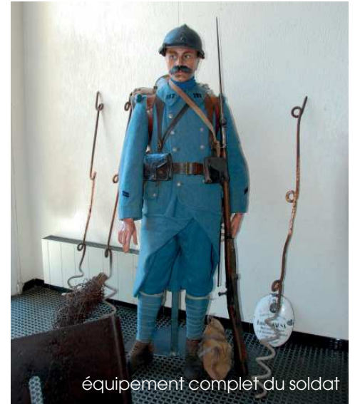
équipement complet du soldat

Riche en documents, notamment sur les Lançonnais morts pour la France, et assortie d'une conférence, elle présentait divers vêtements, armes et objets ; un mannequin portant le complet équipement du soldat offrait une image concrète des conditions de cette époque.