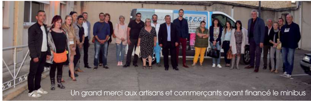
Un grand merci aux artisans et commerçants ayant financé le minibus

La réactualisation des espaces prévue cette année a été réalisée le 12 juillet dernier avec une vingtaine de nouvelles annonces.