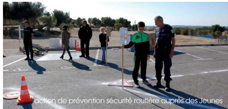
action de prévention sécurité routière auprès des Jeunes

Il est à noter que ce type d'action sera mené de façon récurrente auprès des Jeunes lançonnais par le Service Prévention de la Délinquance, en partenariat avec les différents professionnels du territoire.