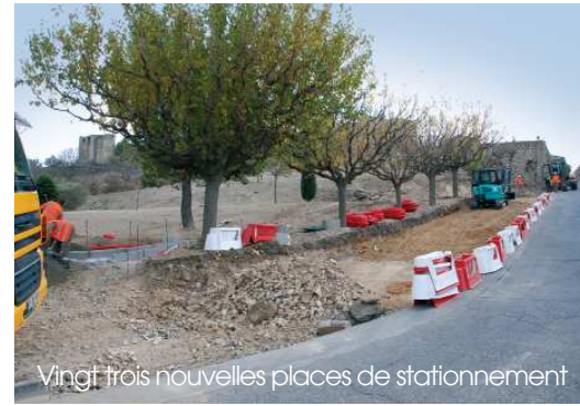
Vingt trois nouvelles places de stationnement

Ce parking est assorti d'un cheminement piétonnier et paysagé, côté jardin. La politique de redynamisation de la ville menée par la municipalité marque ici un nouveau point dans l'amélioration de la qualité de vie des Lançonnais ; aménagement réalisé dans le respect du cadre historique du site.