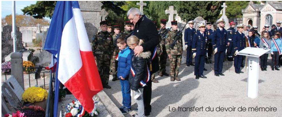
Le transfert du devoir de mémoire

L'Armée française était superbement représentée sur notre Commune à l'occasion des cérémonies du 99ème anniversaire de l'armistice, par une section d'élèves de l'Ecole des Commissaires des Armées et un détachement sous les armes du 25ème Régiment du Génie de l'Air