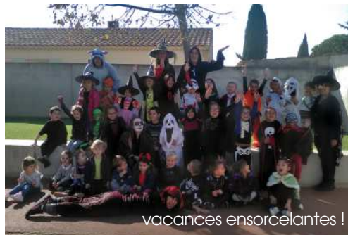
vacances ensorcelantes !

Des vacances pleines de vie et de découvertes pour fêter à sa façon Halloween !