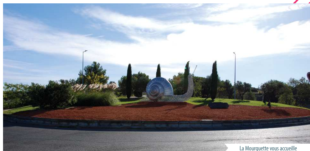
La Mourquette vous accueille

Dans la continuité de ce qui a été réalisé en terme d'image avec la réalisation du rond point des portes de Lançon et celui des Mourquettes , l'aménagement du futur collège et du gymnase en entrée de ville Nord nous a amenés à anticiper son aménagement de la façon suivante :