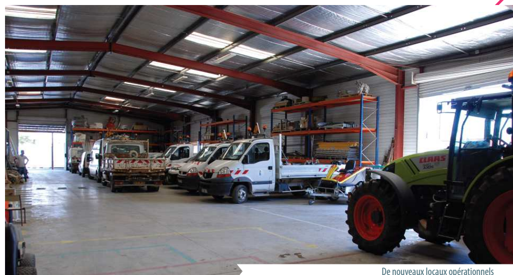
De nouveaux locaux opérationnels

Le déménagement du Centre Technique Municipal, dû à la construction en lieu et place des collèges et gymnase, permet aux équipes techniques de travailler dans un environnement optimisé , les locaux présentant des espaces dédiés à chaque corps de métier, l'emplacement une meilleure liberté de mouvements dans les interventions.