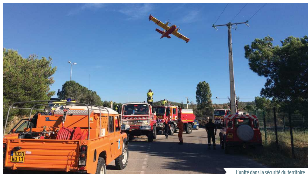
L'unité dans la sécurité du territoire

Pour assurer la sécurité des biens et des personnes et tout particulièrement à proximité directe des écoles.