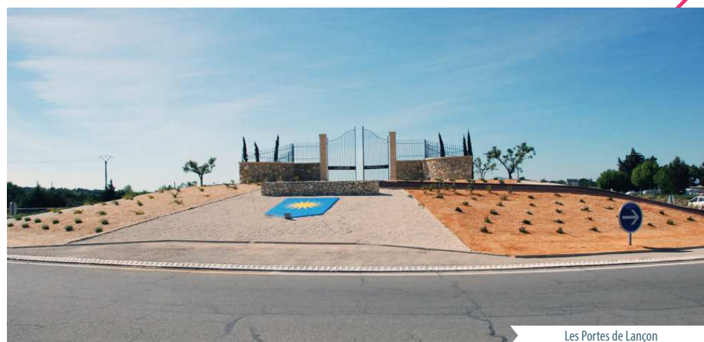
Les Portes de Lançon