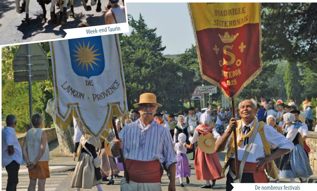
De nombreux festivals