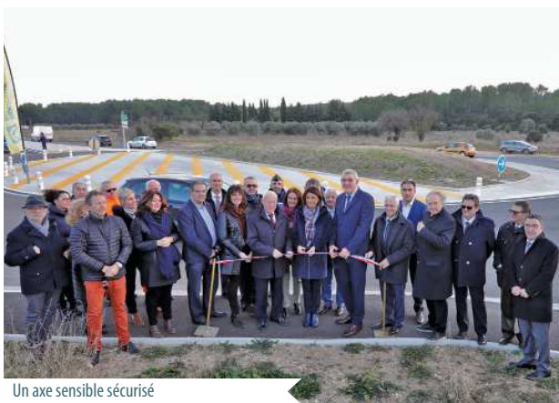
Un axe sensible sécurisé