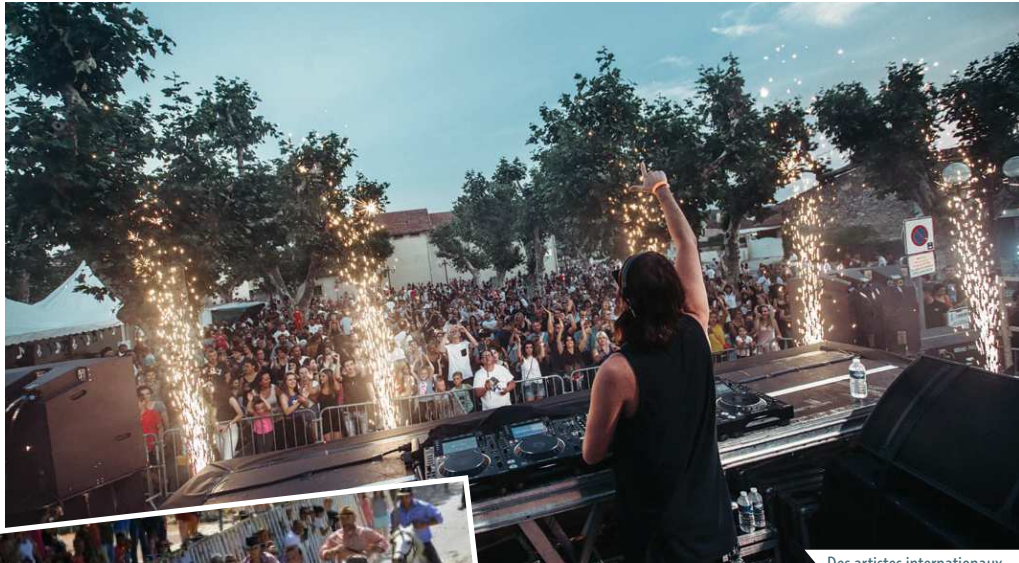
Des artistes internationaux

Le rond-point des Portes de Lançon sur la RD 113, équipé d'attaches, accueille au gré du calendrier les banderoles visibles des milliers d'automobilistes qui empruntent chaque jour cet axe ; il est l'image du renouveau de Lançon et nos voisins ne s'y trompent pas qui répondent nombreux à nos beaux rendez-vous festifs.