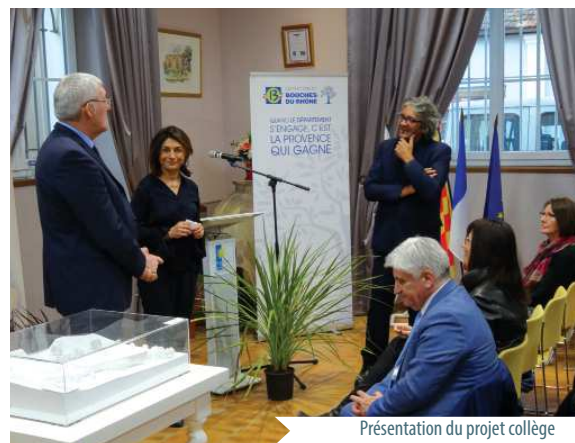
Présentation du projet collège