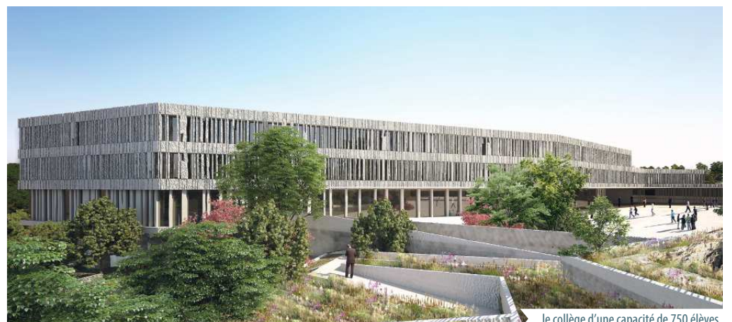
le collège d'une capacité de 750 élèves

** Le Collège : le projet lauréat a enfin été retenu par le jury du Conseil Départemental. C'est l'architecte du MUCEM, Rudy Ricciotti qui en est le concepteur. Il s'agit d'un projet à l'architecture ambitieuse qui s'appuie sur les composantes paysagères du site. Il marquera notre projet «entrée de ville». Nul doute qu'à sa livraison pour la rentrée 2021, il constituera l'un des signaux forts de notre commune et participera grandement à notre identification et notre attractivité.