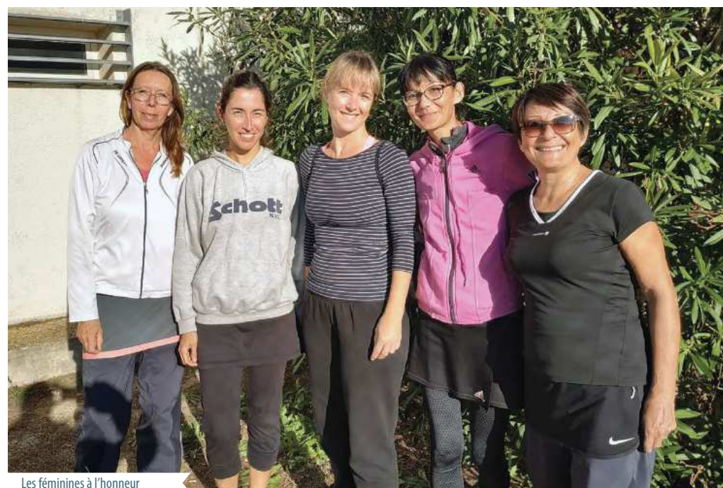
Les féminines à l'honneur

Rendez-vous très prochainement à partir du 24 février pour les championnats séniors sur les courts du TC Lançon (04 90 42 72 81).