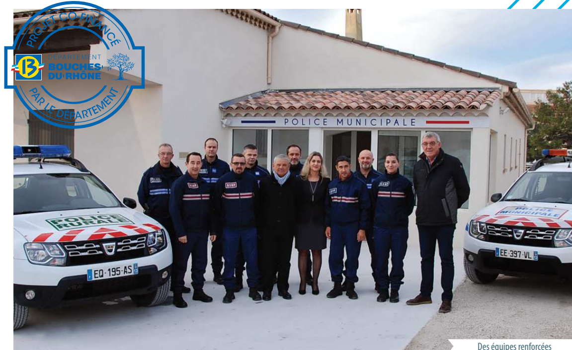
Des équipes renforcées

Le rapatriement en centre-ville du poste de police renforce la stratégie du service par une proximité adaptée et un rayonnement renforcé. Parallèlement, un dispositif « participation citoyenne » est mis en place, ainsi que des actions de prévention de délinquance et de protection des seniors en lien avec le Comité Communal d'Action Sociale.