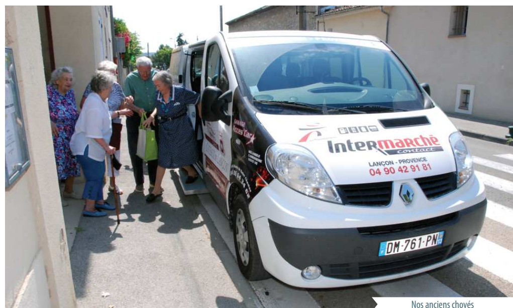
Nos anciens choyés