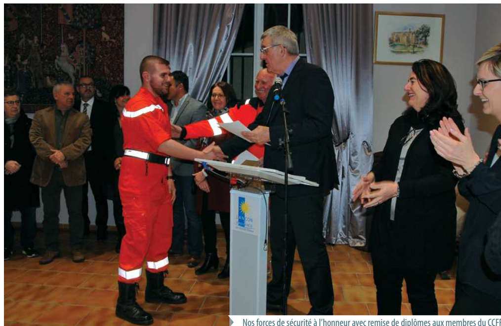
Nos forces de sécurité à l'honneur avec remise de diplômes aux membres du CCF

« Je veux adresser toute notre reconnaissance à toutes les forces de sécurité et de secours, leur action au quotidien est remarquable et malgré des sollicitations en constante hausse, vous faites face... grâce à votre formidable état d'esprit et votre sens du sacrifice... »