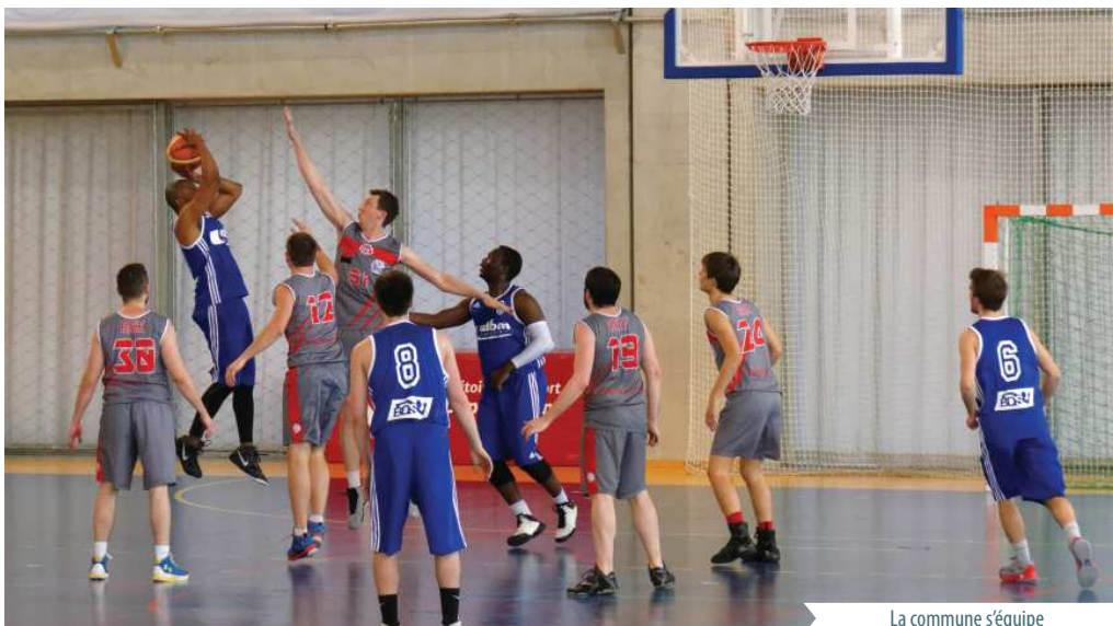
La commune s'équipe

*Notre gymnase : La commune a fait le choix de porter cet équipement pour répondre aux attentes des différents utilisateurs en terme d'offres d'équipements sportifs : scolaire (Collège) ; associations sportives. Les éléments du programme basé sur les attentes minimum exprimées par le Conseil Départemental, ont ainsi fait l'objet d'une concertation avec les différentes associations dans l'objectif d'arrêter un projet en relation avec les besoins exprimés et avec la capacité financière de la commune.