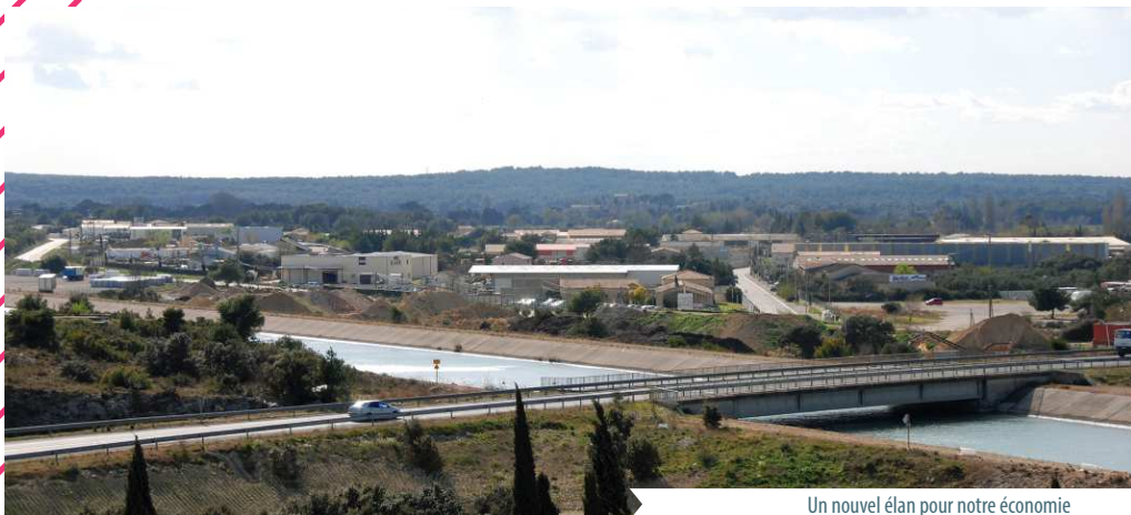
Un nouvel élan pour notre économie

D'autre part un partenariat avec La Poste a permis la normalisation de l'adressage et la dénomination de nouvelles voies sur ces deux zones permettant une parfaite localisation des activités et assurant une organisation optimale de la zone.