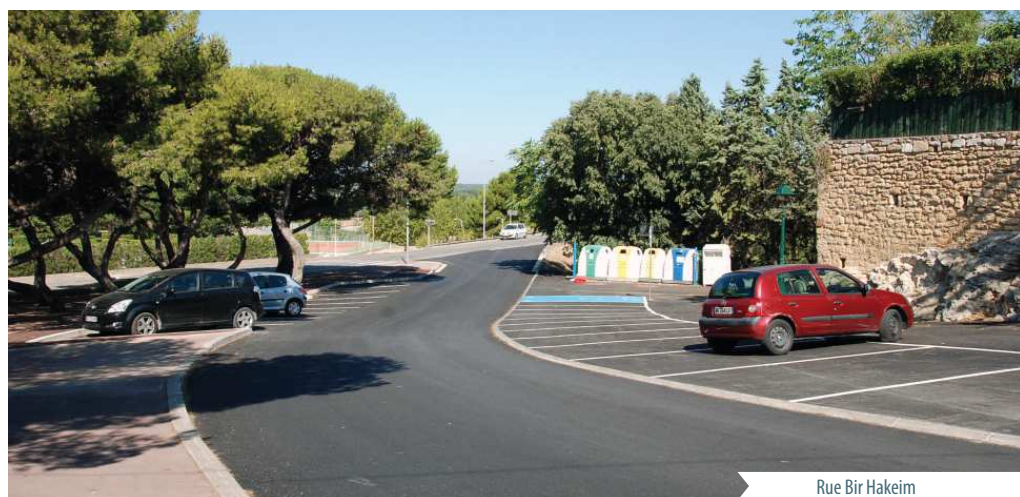
Rue Bir Hakeim

points d'éclairage urbain passés en technologie Led