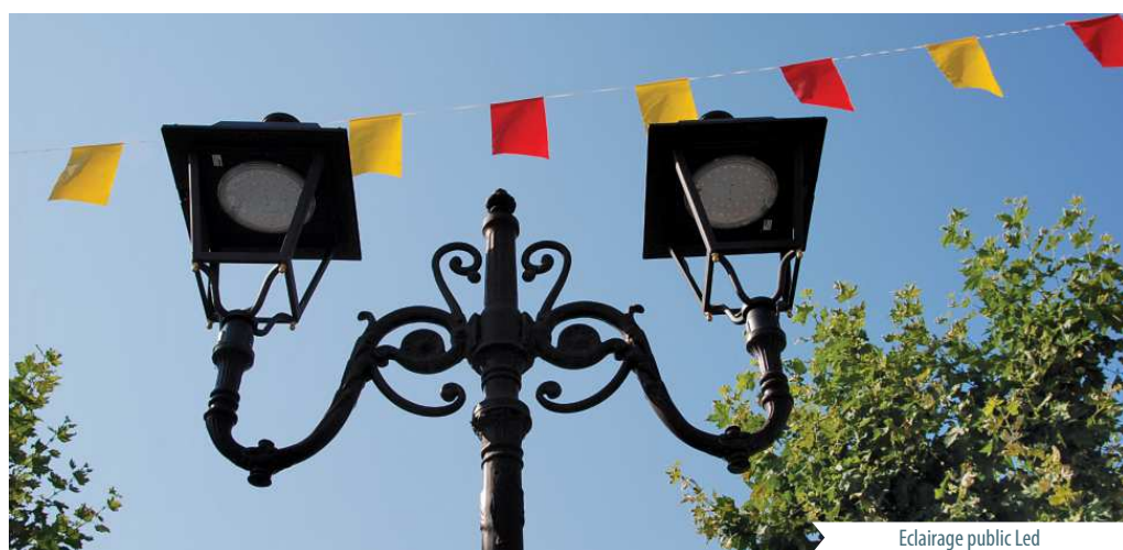
Eclairage public Led