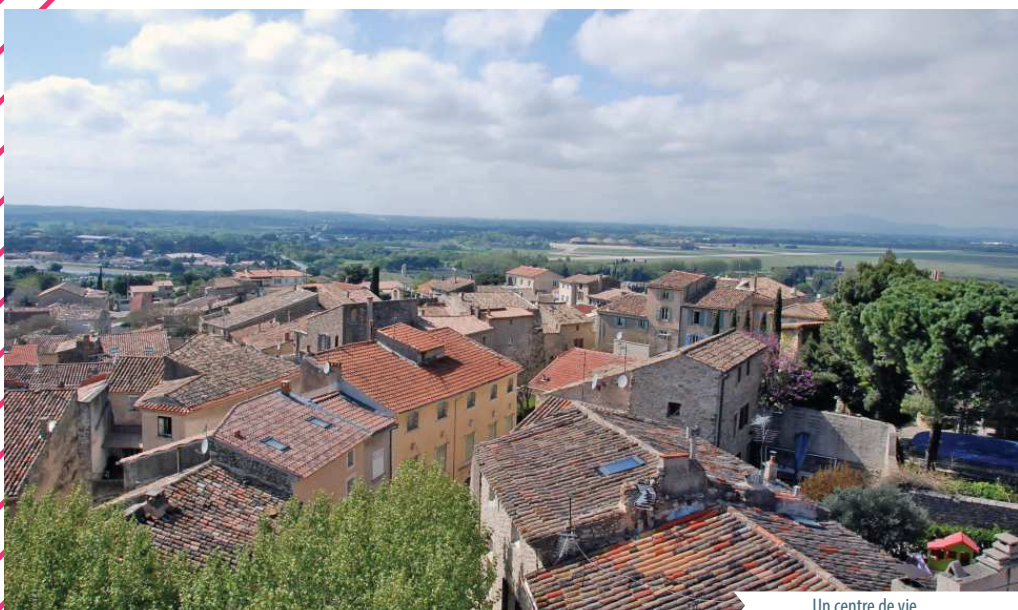
Un centre de vie

Extrait : « Sur la base des critères énoncés ci-dessus et suite à la proposition des maires, les opérations d'aménagement suivantes sont reconnues d'intérêt métropolitain : - « Cœur de ville de Lançon-Provence » basé sur la restructuration de la cave viticole, ce projet représente un enjeu fort pour créer une centralité en articulation avec le noyau ancien et le centre Marcel Pagnol. La réalisation de ce projet représente également une opportunité pour la requalification des espaces publics. Afin de renforcer le lien urbain et fonctionnel du centre-ville, de consolider son statut de pôle de centralité et de développer l'attractivité touristique du centre ancien ».