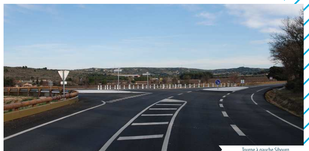
Tourne à gauche Sibourg