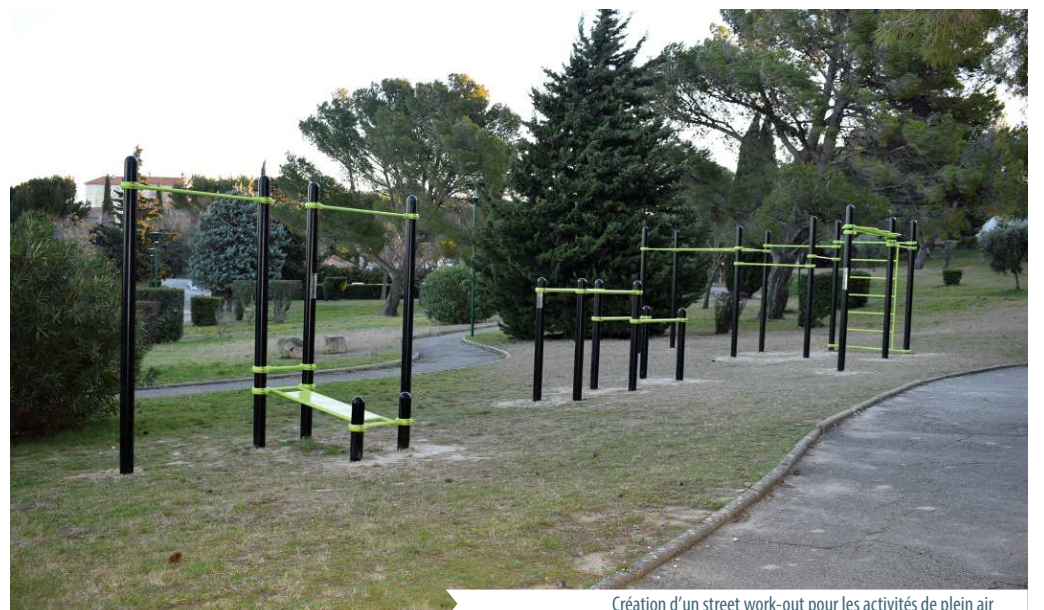
Création d'un street work-out pour les activités de plein air