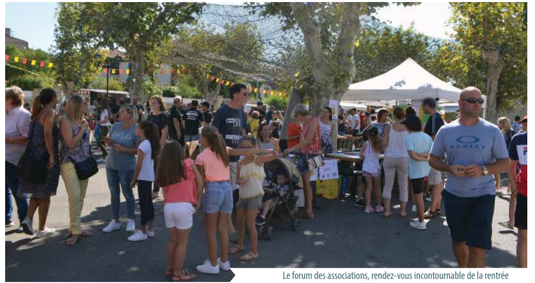
Le forum des associations, rendez-vous incontournable de la rentrée