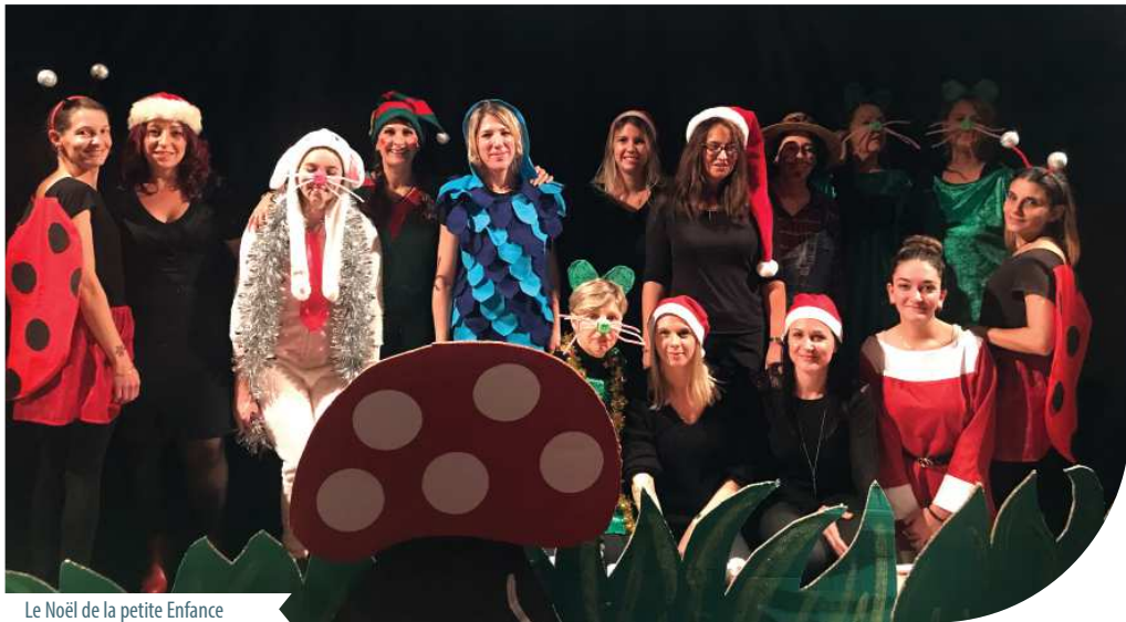
Le Noël de la petite Enfance