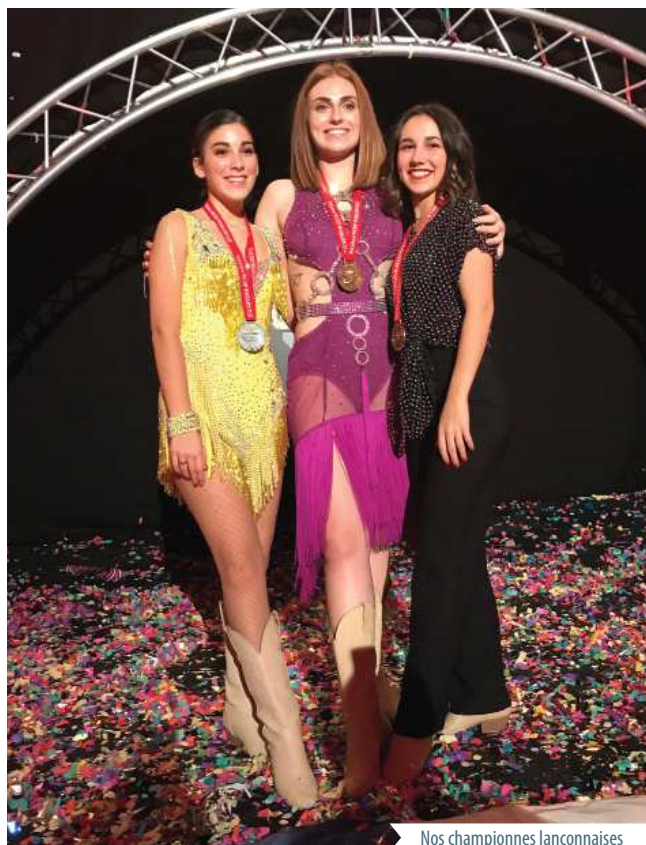
Nos championnes lançonnaises