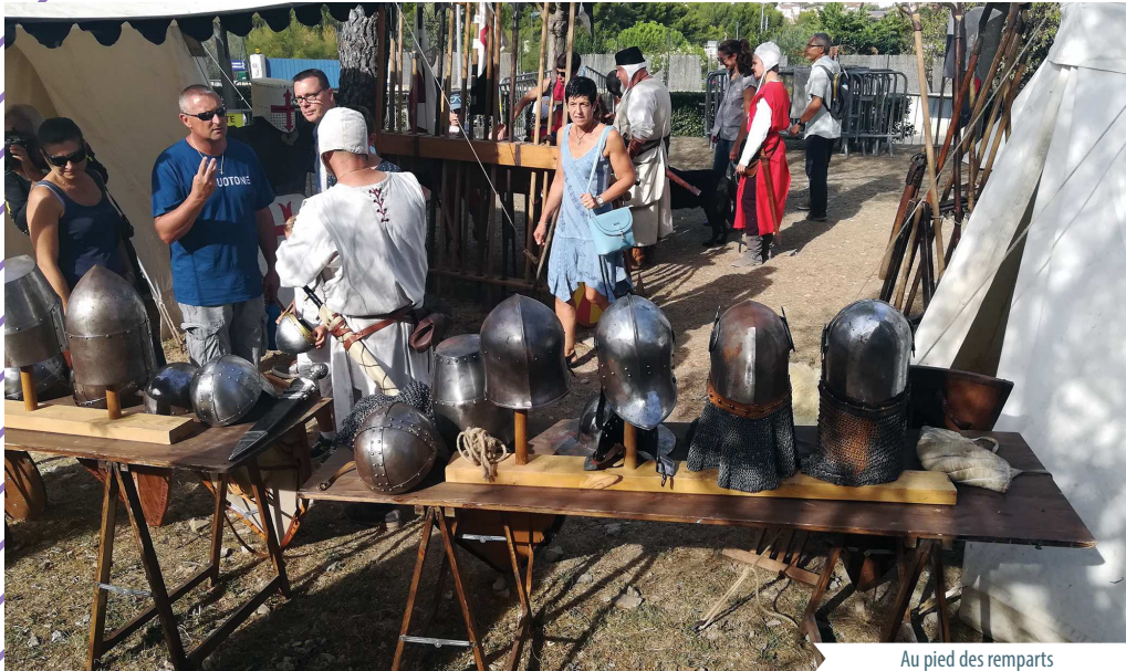
Au pied des remparts