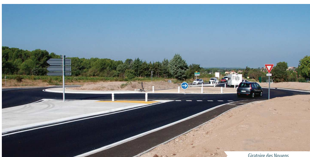
Giratoire des Nouens