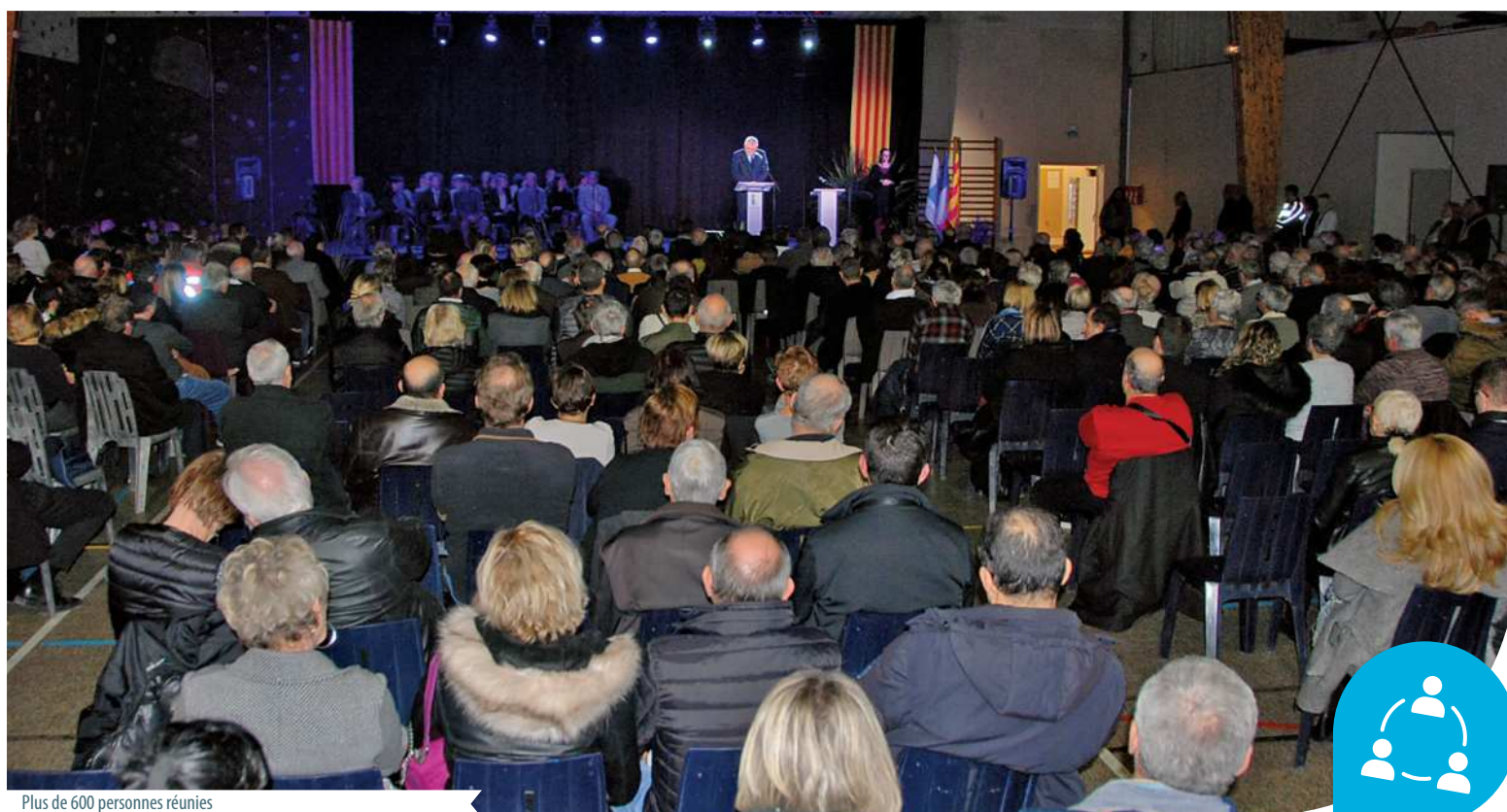
Plus de 600 personnes réunies

Suite à une procédure d'appel d'offres, l'entreprise Carpostal assurera les transports urbains de ce réseau pendant deux années. La Métropole AMP a souhaité optimiser l'offre de transport et améliorer la qualité du service apporté aux usagers du territoire du Pays Salonais. Ainsi, de janvier à juillet 2019, de nombreuses modifications seront apportées. Les lignes concernant Lançon sont la 11 (Sénas-Lamanon-Salon-Lançon-Val de Sibourg) et la 14 (Lançon-La Barben-Pélessanne-Salon) ; les horaires actuels des lignes 11 et 14 sont valables jusqu'au 7 juillet. Infos + : 04 90 56 50 98 libebus.com ; lepilote.com