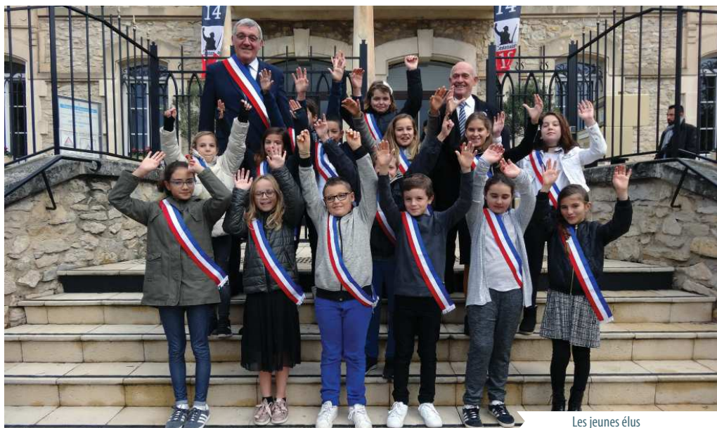
Les jeunes élus

10 conseils municipaux par an, 3 à 4 sorties à thème, participation aux cérémonies officielles, tribune ouverte lors des vœux à la population.