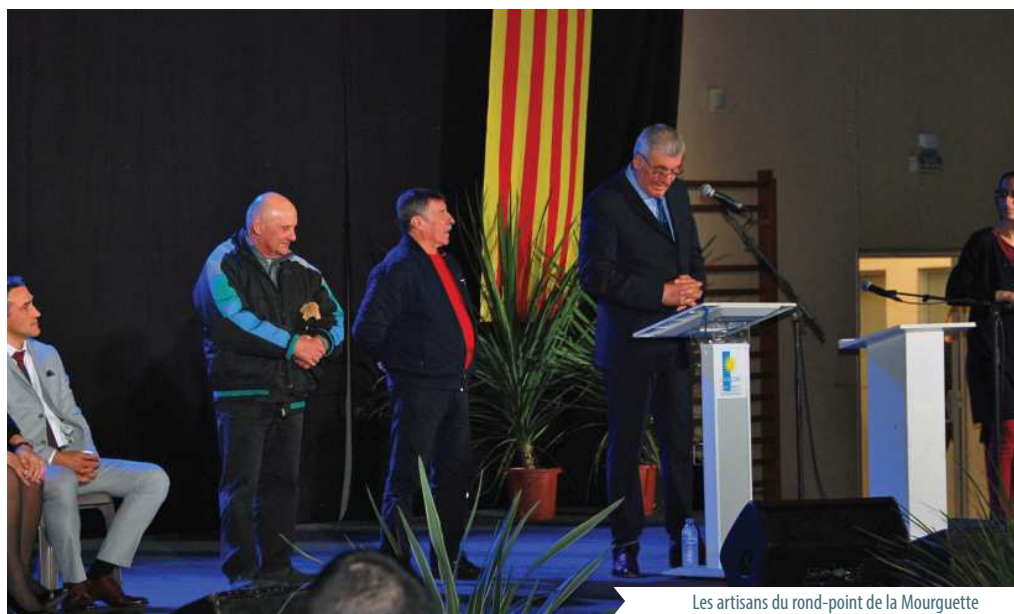
Les artisans du rond-point de la Mourguette

Il a ensuite résumé les importants aménagements sécuritaires réalisés : routiers, de tranquillité publique, de sécurité civile ; soulignant l'aide indéfectible du Département, en même temps que l' image attrayante apportée à la commune, honorant en parti-