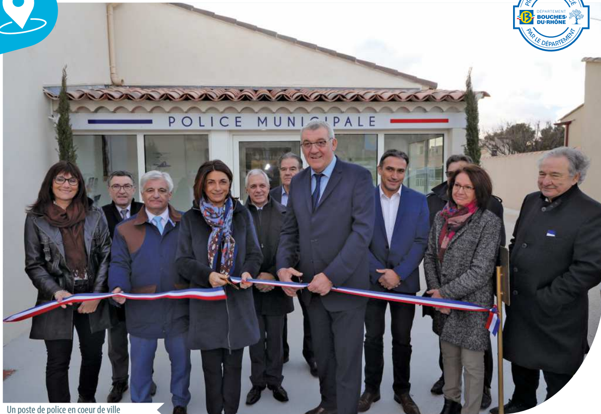
Un poste de police en coeur de ville