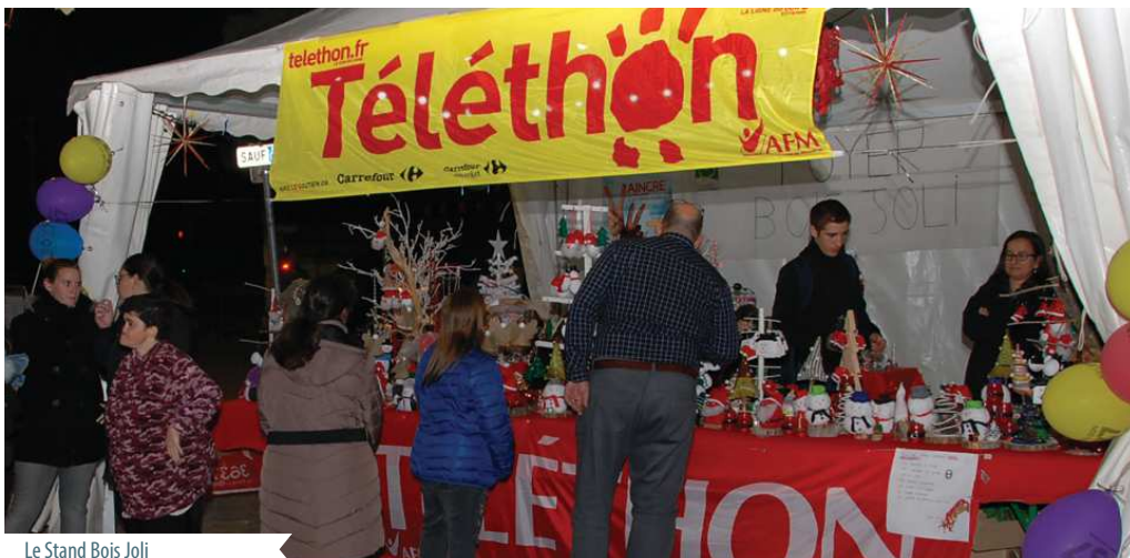
Le Stand Bois Joli

Un grand merci à tous les bénévoles, Lançonnais et commerces participants.