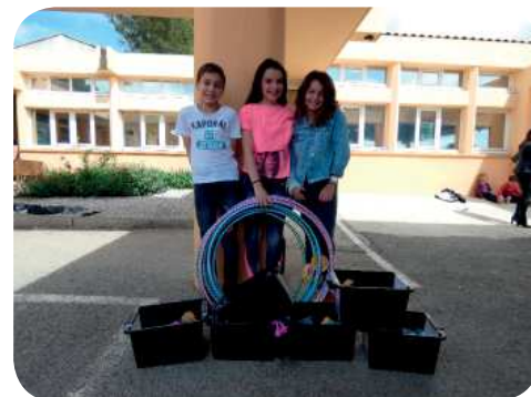
Ecole de Marie Mauron

Un intervenant a ensuite abordé deux sujets qui, du fait de leurs proximités géographiques avec l'école des Baïsses ont également intéressés les enfants. Le premier est la découverte photographique du site de l'oppidum de Constantine et de son histoire mouvementée. Le deuxième est un exposé sur les aigles de Bonelli, car un couple de cette espèce, vie et se reproduit dans les collines proches. Les très nombreuses questions qui ont été posées par les enfants sur chacun des sujets abordés ont été révélatrices de l'intérêt qu'ils ont porté tous au long de cette formation.