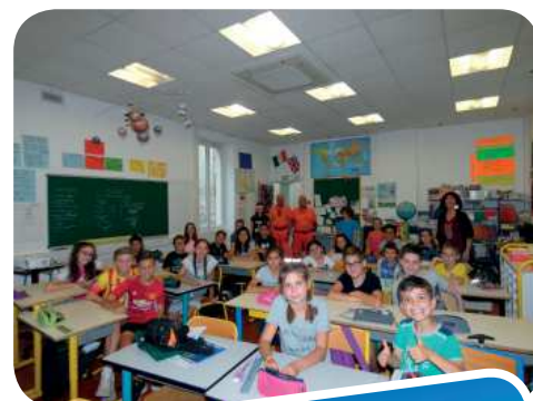
Ecole des Baïsses