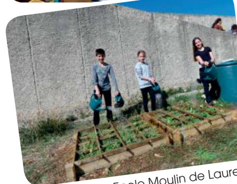
Ecole Moulin de Laure