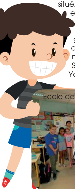
Ecole de Sibourg