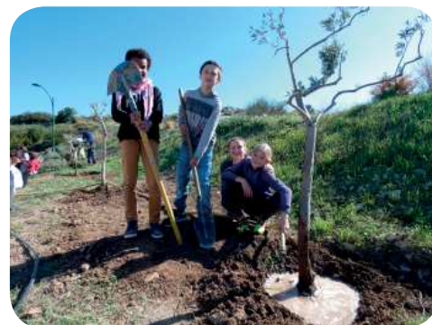
Ecole des Pinèdes