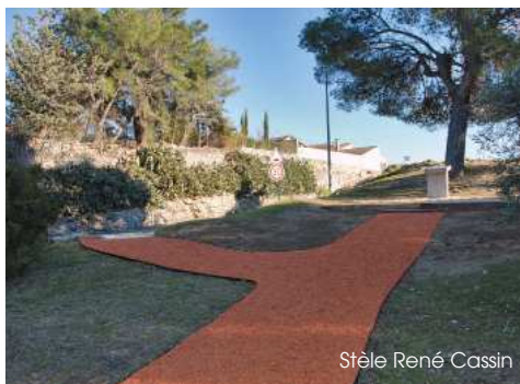
Stèle René Cassin

- le nom de la commune est inscrit en grandes lettres colorées près du blason, dans l'espace au croisement de l'avenue Général Leclerc, de la rue Carnot et du chemin Notre Dame.