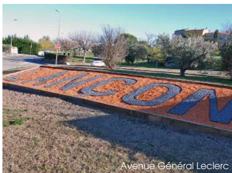
Avenue Général Leclerc